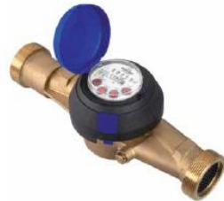
Рис. 2 Лічильник води JS

* Цей ТЕХНІЧНИЙ ПАСПОРТ ПРИЛАДУ складено виробником APATOR POWOGAZ S.A., м. Познань, Польща, та постачається до кожного приладу. В зв'язку з неможливістю нанесення на лічильному механізмі знаку відповідності та додаткового метрологічного маркування, таке маркування наноситься на супровідні документи (п. 62 Технічного регламенту засобів вимірювальної техніки, затверджений постановою КМУ від 24 лютого 2016 р. № 163.).